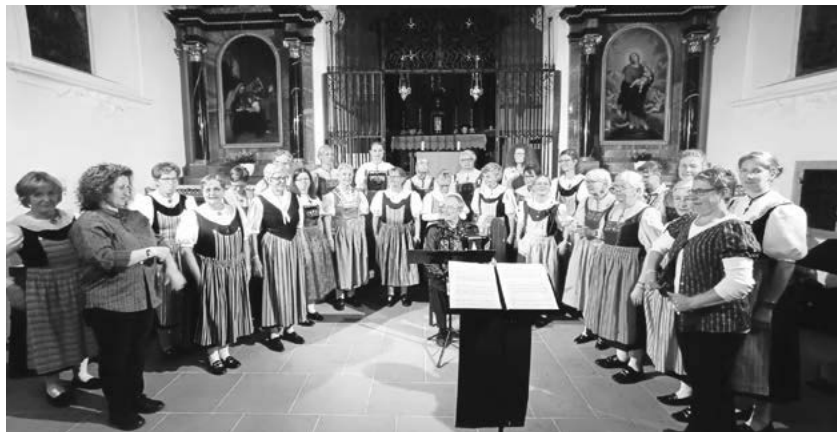
Auftritt in der Liebfrauenkapelle